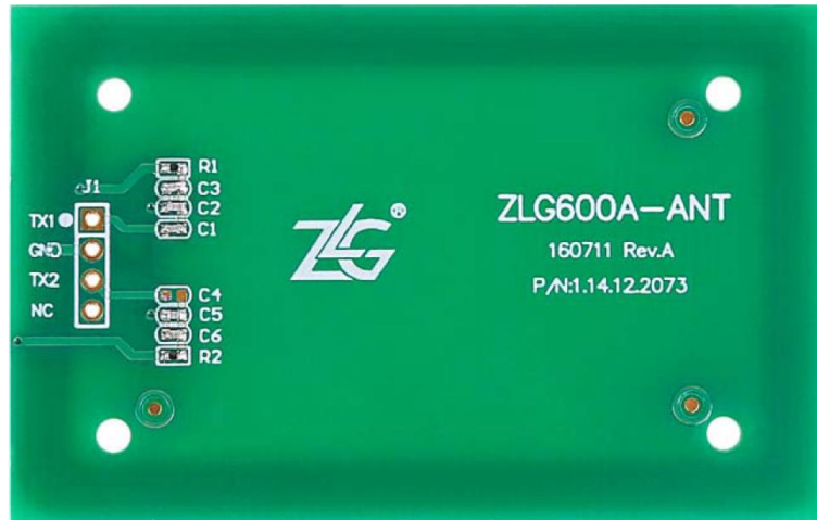
图 1.1 ZLG600A-ANT

ZLG600A-ANT 天线板是作为读写卡模块的配件使用，与此型号的天线板配套使用的读写卡模块为 ZLG600A-DT。读卡模块与天线板之间可以通过普通导线或者同轴电缆连接，这种分开连接的方式使得模块的安装更为灵活，实现两路天线分开安装。