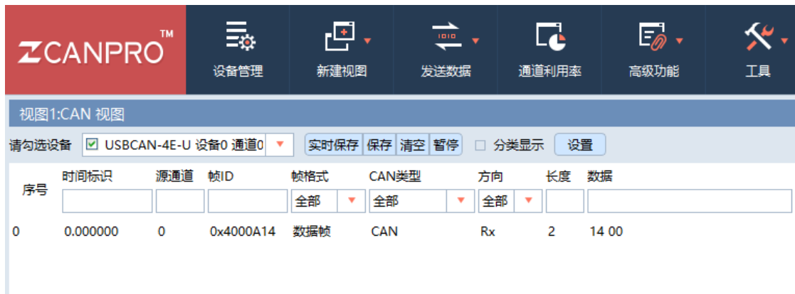
图 2.3 数据交互

USBCAN 收到的 J1939 报文如图 2.所示。由图可知，此数据和配置的 PXB-6023 的数据相符。PXB-6023 读取 Modbus 数据，转成 J1939 数据输出。