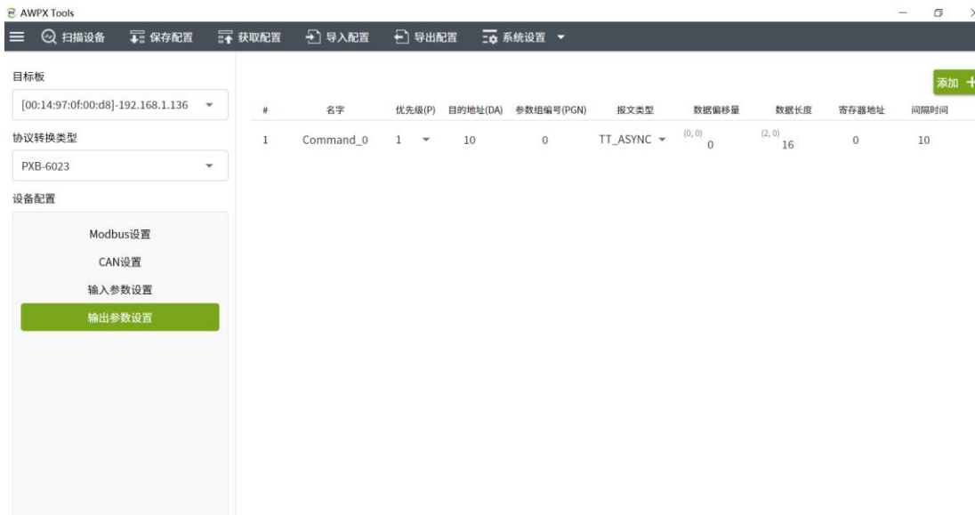
图 2.2 配置 PXB-6023